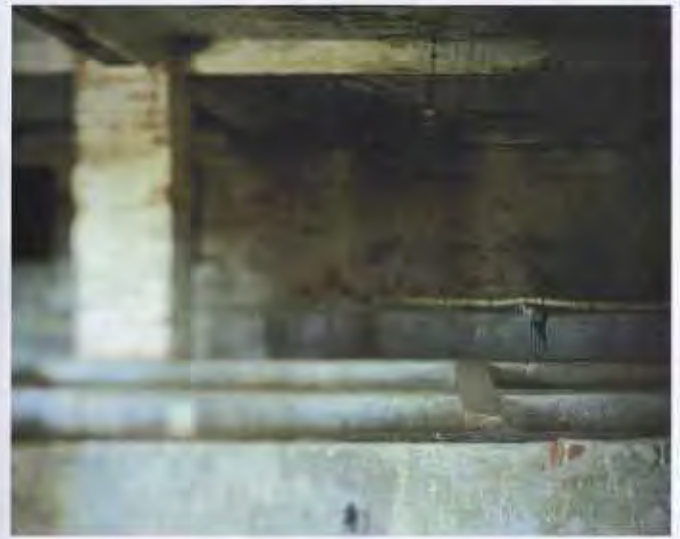
réponses photo - n°303 février 2020