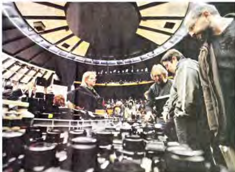
La bourse photo de Riedisheim... le déclic parfois pour débiter une collection.

Autre pièce rare, cette caméra Jofallex made in Ma-