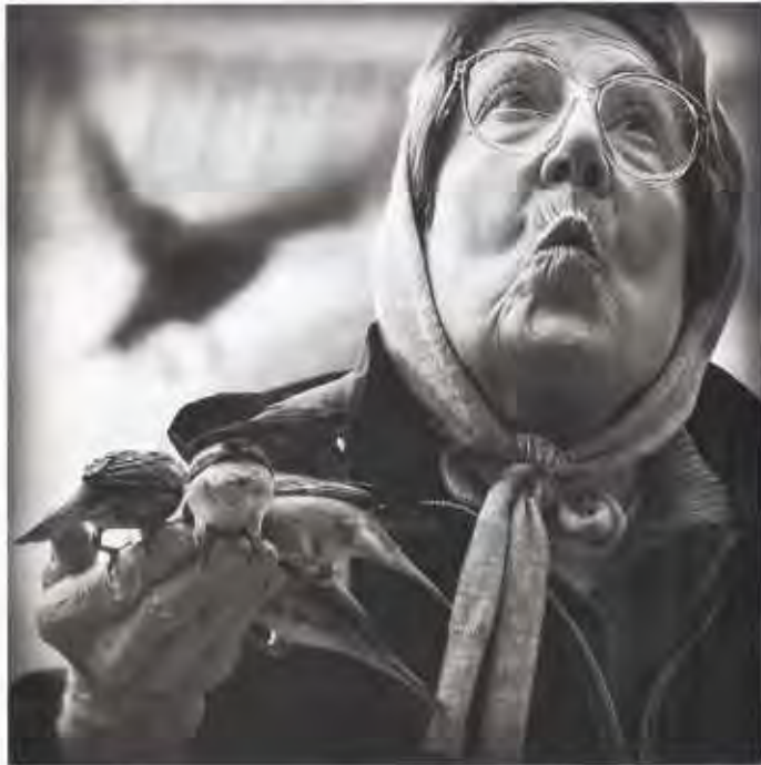
réponses photo - n°303 février 2020

Près de 150 dossiers sont parvenus à la rédaction. Une vingtaine se sont retrouvés en finale. Le jury, composé de trois membres de la Semaine Photo de Riedisheim et d'un membre de la rédaction de RP a finalement retenu les trois dossiers vainqueurs. Ils gagnent des imprimantes Epson de grande qualité et une exposition à Riedisheim en mars prochain.