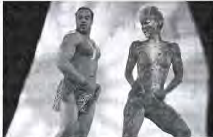
Le rideau est tombé sur la semaine photo par le feu d'artifice du spectacle de body painting.

Il a gagné un bon pour une location d'une semaine à bord de bateaux de rivière sans permis pour 4 à 6 personnes au départ de Castelnau-Valery. La seconde Monique Deyber de Hochstatt a