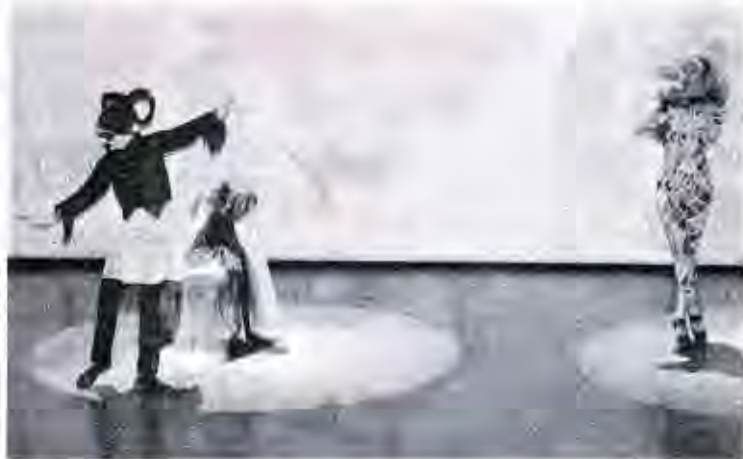
L'animation de body-painting est toujours fort prisée du public.

Les différents lieux de culte abriteront également des expositions de jeunes photographes et la Regio expo. La Ruche quant à elle hébergera la beauté féminine magnifiée