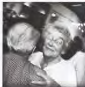
réponses photo - n°303 février 2020