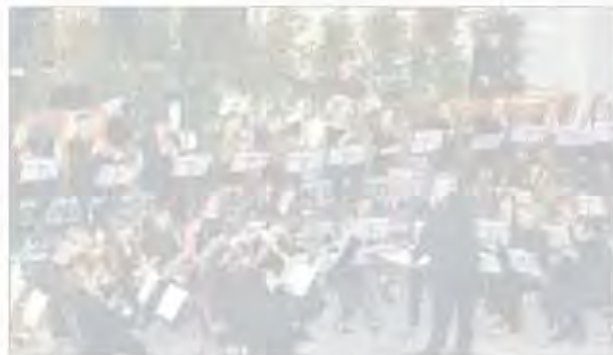
L'Orchestre d'harmonie de Brunstatt donnera un concert de gala.