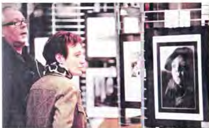
« Personnellement, avant de prendre une photo de quelqu'un, j'oublie mon appareil et je vais parler à cette personne... »

La salon international de la 22 e Semaine de la photo de Riedisheim s'est notamment conclu hier par le traditionnel et toujours émoustillant body painting. Une animation parmi de nombreuses autres toutes centrées sur l'image, les images que se renvoient incessamment les humains.