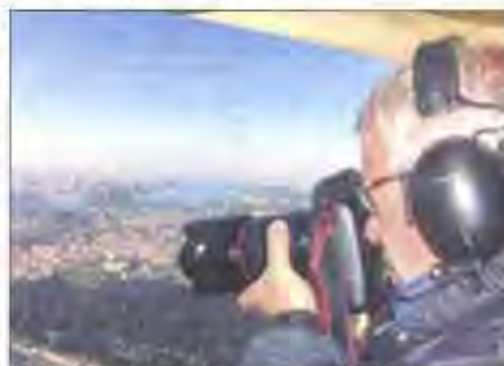
Philip Plisson, photographie de la mer, sera l'un des invités d'honneur.