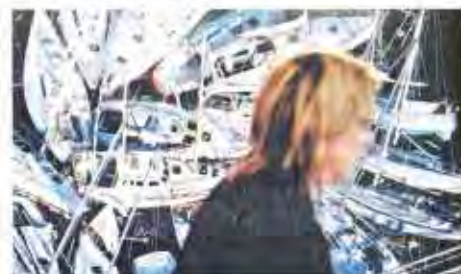
En posant devant une oeuvre de Pissarro.