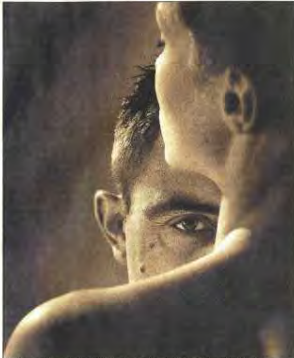
L'ŒIL de Dominique Tuillard, une des 400 photos sélectionnées.