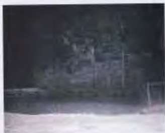
réponses photo - n°303 février 2020

Anthony Caccoroli (Cosenza) La série d'architecture réalisée à la fin des 80's et 40's se termine "Impression". Ce thème suggère qu'il s'agit d'une "vase organique" présente et le "sacré". Les motifs, flous et incertains mais par Anthony nous donne de révélation de la beauté. Son mélange de couleurs froides, italiens par les choses petites, nous fait sentir bébé et adulte. Ce sont deux des aspects de voir un à l'autre à travers un écran. Un voyage lumineux et soigné, surtout de local en local.