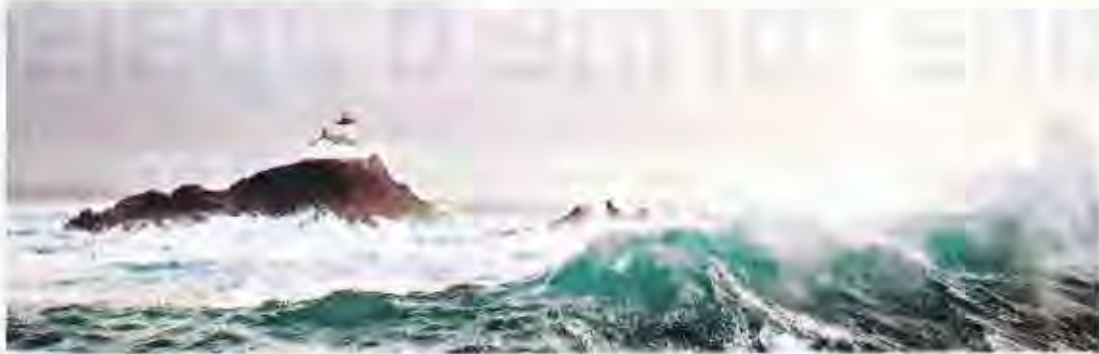
Phare sous la tempête.

La tempête Philip Plisson arrive. Samedi soir, il viendra à la rencontre de son public au cours d'une conférence qui se déroulera à 20h30 dans la salle de théâtre de la Grange à Riedisheim.