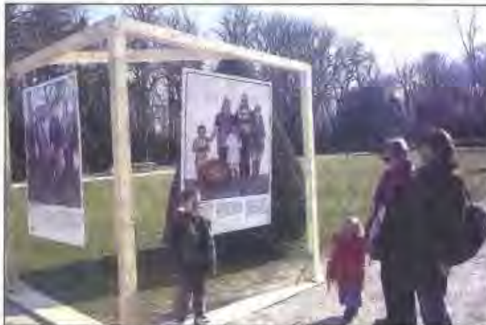
Une vingtaine de photos de familles du monde entier surprenantes.