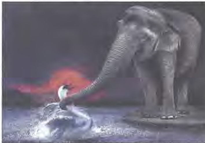
L'étonnant Lass mich los, premier dans la catégorie couleur.