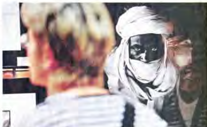
« La photo ne viendra qu'après cette prise de contact, ce début de relation », indique un photographe amateur, connaisseur de l'Asie.

Revenant sur les poses, naturelles ou pas, devant l'objectif, Jean-Claude remarque :