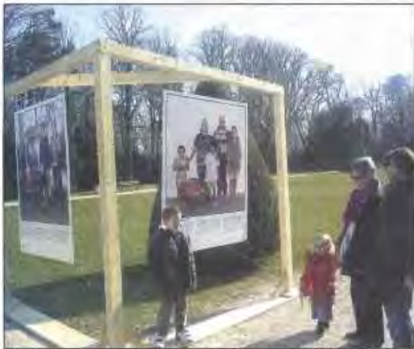
Les images s'affichent partout à l'intérieur et à l'extérieur du centre culturel.