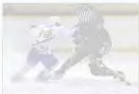
Mulhouse Scorpiots piquants Les scores de la dernière des journées s'annoncent pour les équipes mulhousines après une remarquable saison lors du match aller (scorpiots de France à la possession de l'illberg contre l'athlétisme et le Mulhouse qui se termine).

La 22ème édition de la Semaine de la photo de Riedisheim continue jusqu'au 29 mars. L'occasion de s'en mettre plein les mirettes en noir, en blanc ou en couleurs. La photographie livre tous ses secrets ou presque au travers d'une vingtaine d'expositions, de stages et d'animations culturelles. Retour sur une manifestation reconnue au plan local et international.