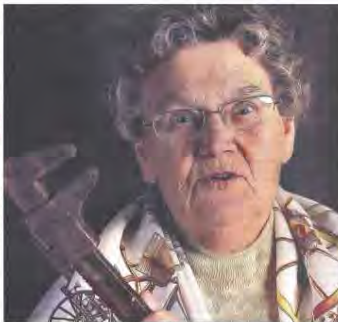
Cette pensionnaire de la résidence Le Bois gentil s'est laissée prendre en photo — clé à molette en main — pour les besoins de l'expo.

Ensuite, c'est un jeu d'enfant que d'imprimer l'image, gratuitement, qui viendra alimenter l'exposition aux mille mémés adorées. L'auteur de la plus belle photo sera récompensé par une imprimante.