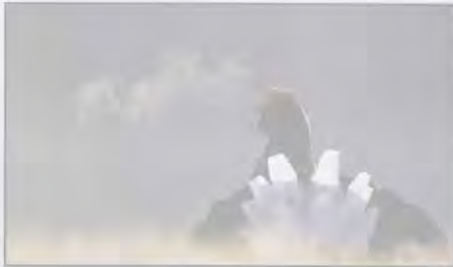
Exposer les photos