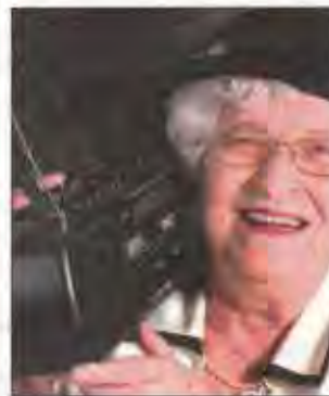
Les mamies sont à l'honneur.

Pour sa 22 e édition, la semaine internationale de la photo de Riedisheim se développe encore, avec toujours plus d'expositions aux quatre coins de la ville, toujours plus de rencontres et de stages proposés. « Nous souhaitons réellement diversifier la